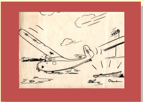
Les incidents donnaient lieu à dessin humoristique affiché en bonne place Lazzis et quolibets pleuvaient sur le malheureux pilote!

Les documents à fournir sont essentiellement des documents financiers comme le compte de résultats, le bilan, le rapport des commissaires aux comptes ou du cabinet comptable, le plan de financement de l'acquisition envisagée et bien entendu, les courriers de notification des aides accordées par les collectivités ou les ministères.