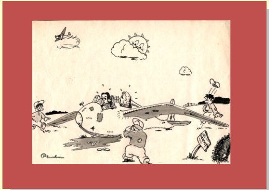
Dessins historiques de Chérence en 1946. Les pilotes féminines étaient présentes et se faisaient déjà brocarder !