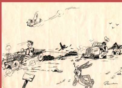
Le treuil ! Déjà ! les anciens se souviennent de multiples gags... au sol, fort heureusement !