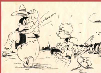
Les vaches étaient nombreuses et l'accueil dans les champs était parfois véhément !