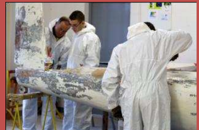
Décapage d'un C 800 pour remise en état de vol

Les derniers développements : le 13 février a eu lieu une assemblée générale. Une nouvelle gouvernance est en place. Le conseil décide d'attendre quelques petites semaines pour laisser le temps aux nouveaux dirigeants de trouver les solutions de désendettement vis-à-vis de l'ANEPVV, (remboursement de 50 000 sur les 140 000 € en négatif). Le conseil est également en attente du nouveau plan de développement du club.