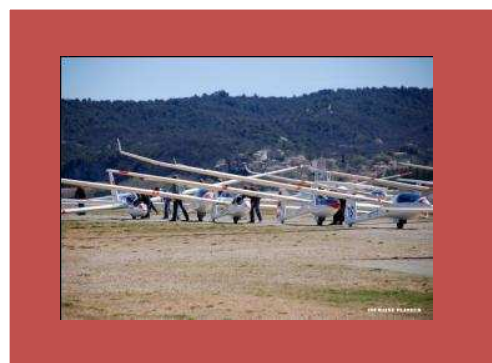
... des encombrements sur la piste des grands clubs des Alpes...