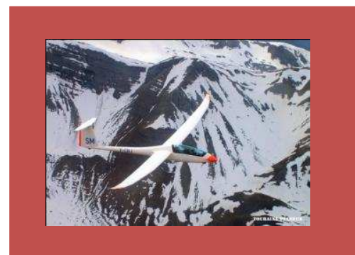
... et du bonheur de survoler des paysages de rêve