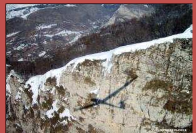
C'est le temps des stages de vol en montagne...