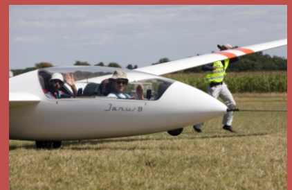
Décontraction totale au décollage pour ces concurrents ! Mais, qui pilote ?