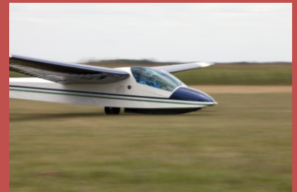
Un capstan, planeur britannique au nez d'oiseau des îles et qui a fait fureur dans le petit temps

Le SEFA fusionne avec l'ENAC qui devient un établissement public à caractère