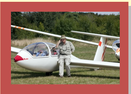
Les affaires sont les affaires, même avant un décollage en concours amical !