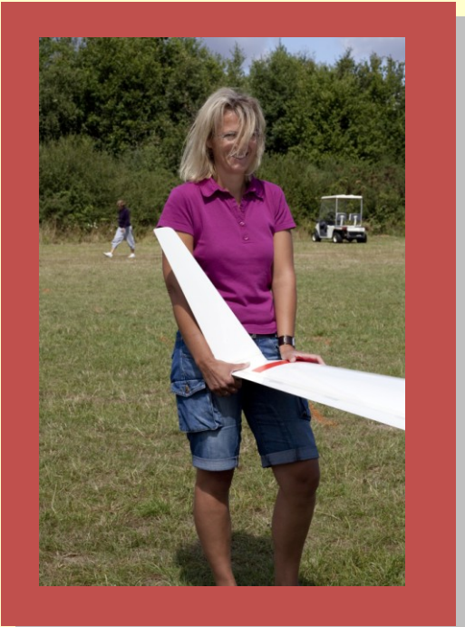
Certains pilotes ont parfois la chance d'être assisté au décollage par un charmant sourire !

Une remarque est faite, à nouveau, sur les pilotes qui ne volent pas durant l'année et qui effectuent trop peu d'heures de vol. Ces pilotes peu expérimentés, même s'ils ont obtenus leurs brevets voici plusieurs années sont trop souvent relâchés trop vite.