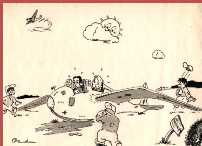
Dessins historiques du club de Chérence, dessins datés de 1946. Les pilotes féminines étaient présentes et se faisaient déjà brocarder !

Le conseil demande à Christian BON de bien vouloir préparer une liste des moteurs utilisés sur les machines motorisés afin de les classer en catégorie, le but étant d'étudier une nouvelle tarification.